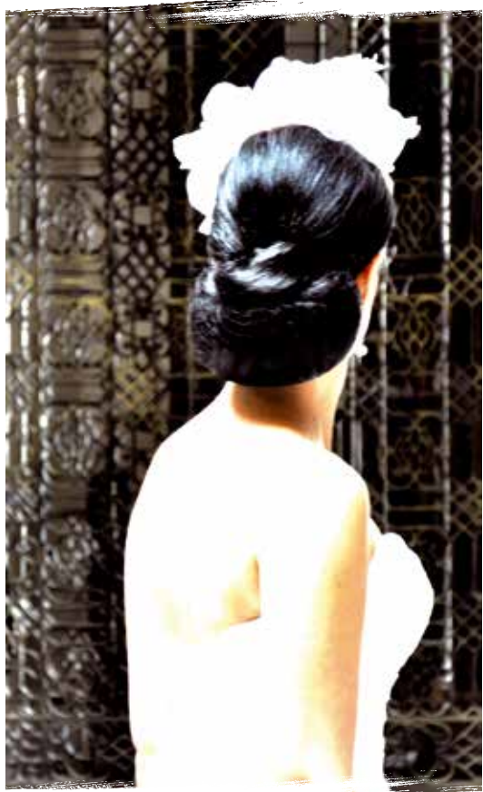
Peluquería y maquillaje