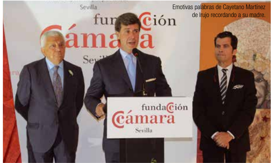
Emotivas palabras de Cayetano Martínez de Irujo recordando a su madre.