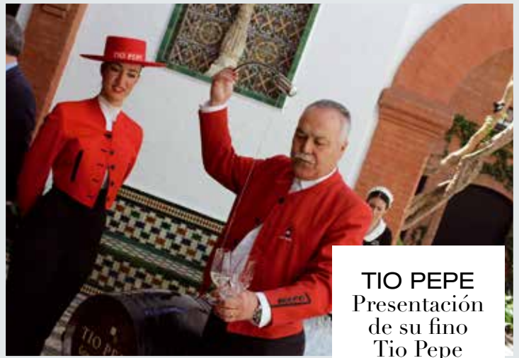
TIO PEPE Presentación de su fino Tio Pepe en Rama en la Casa Guardiola

presentando este cupón Oferta no acumulable