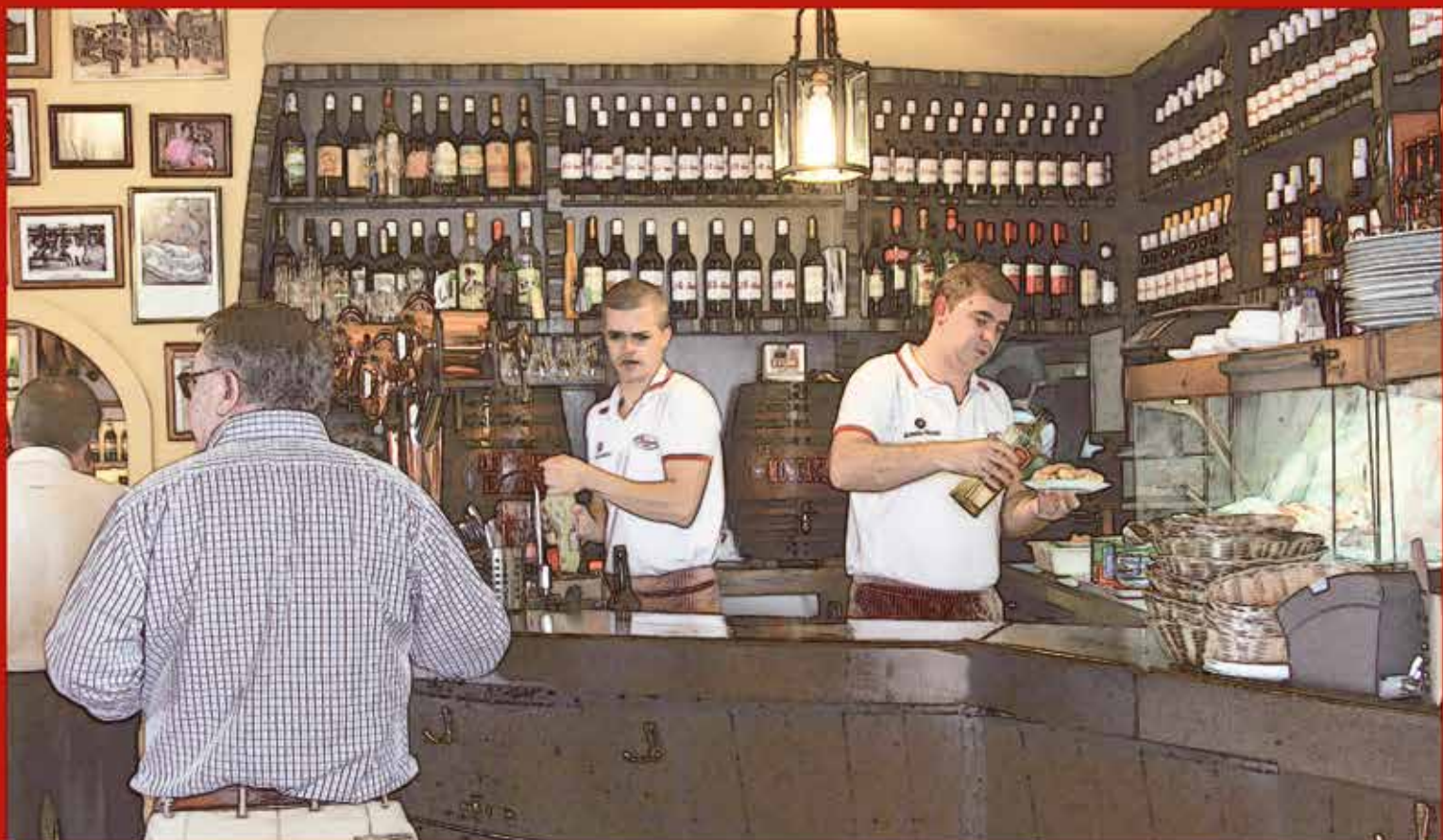
Calle Ancha, 2, Sanlúcar de Barrameda, Cádiz