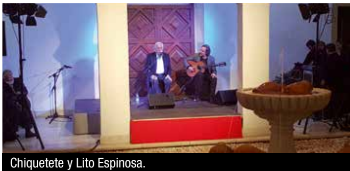
Chiquetete y Lito Espinosa.