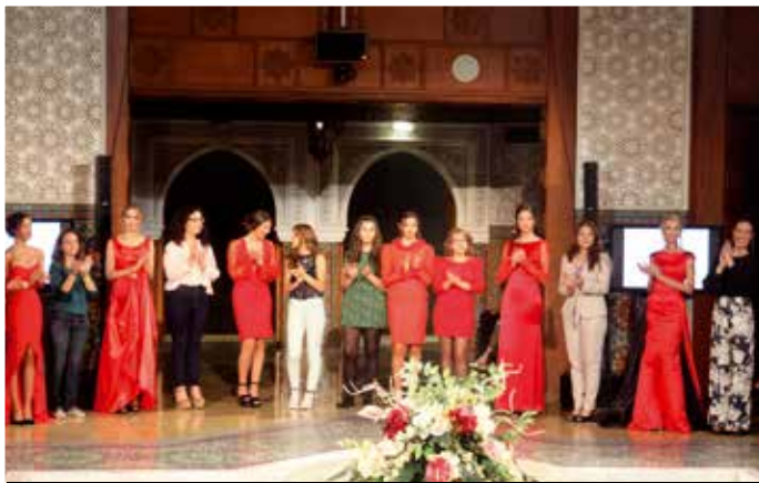
Modelos y diseñadores participantes.