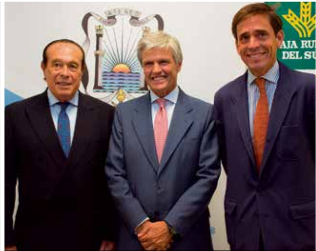
Curro Romero, Juan Antonio Ruiz "Espartaco" y Eduardo Dávila.