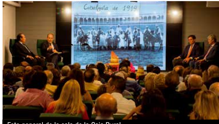
Foto general de la sala de la Caja Rural.