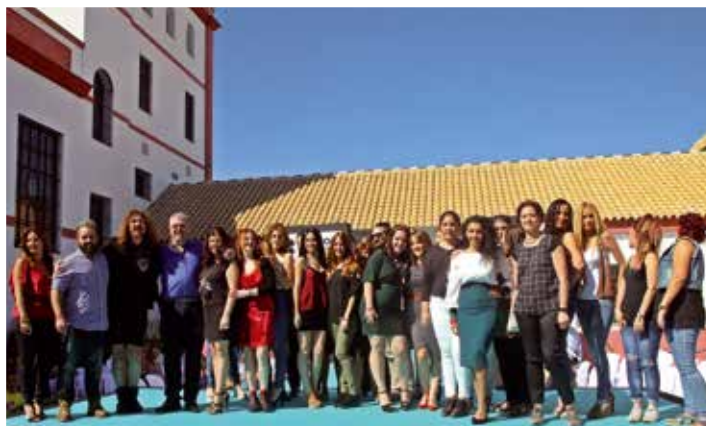
Empresarios, comerciantes, maquilladoras y peluqueras del evento.