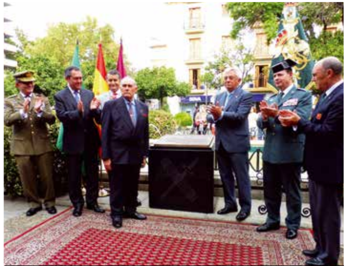
Momento en el que se descubre el monolito homenaje a la Guardia Civil.

Tetuán, 9 - 41001 Sevilla Tel. 954 22 37 48 www.joyeriachico.com joyeriachico@hotmail.com