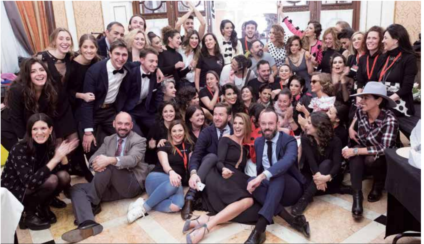
Equipo de Go Eventos.