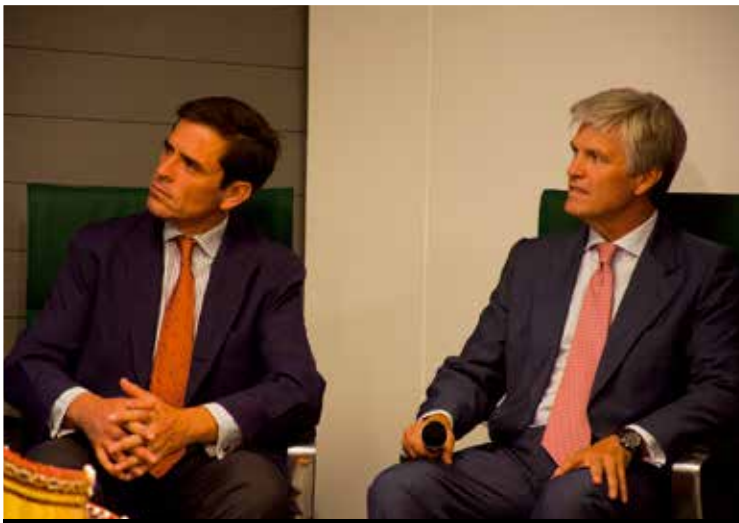
Eduardo Dávila Miura y Juan Antonio Ruiz "Espartaco".