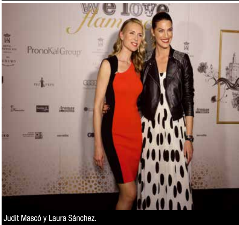
Judit Mascó y Laura Sánchez.