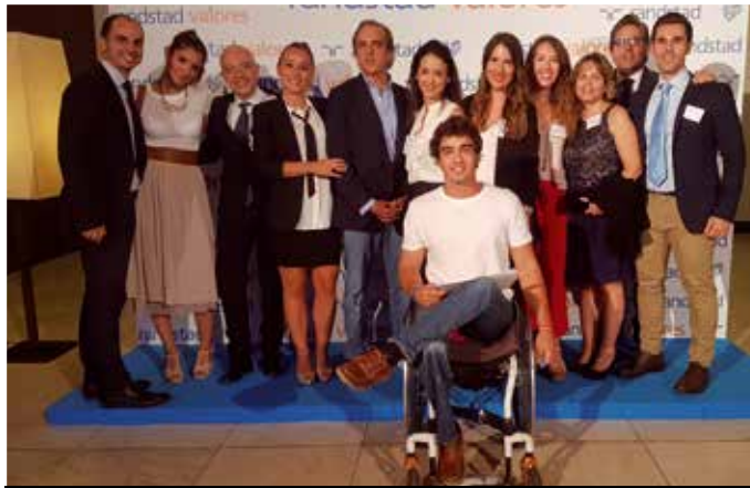
El equipo organizador del encuentro "Valores" con los ponentes.