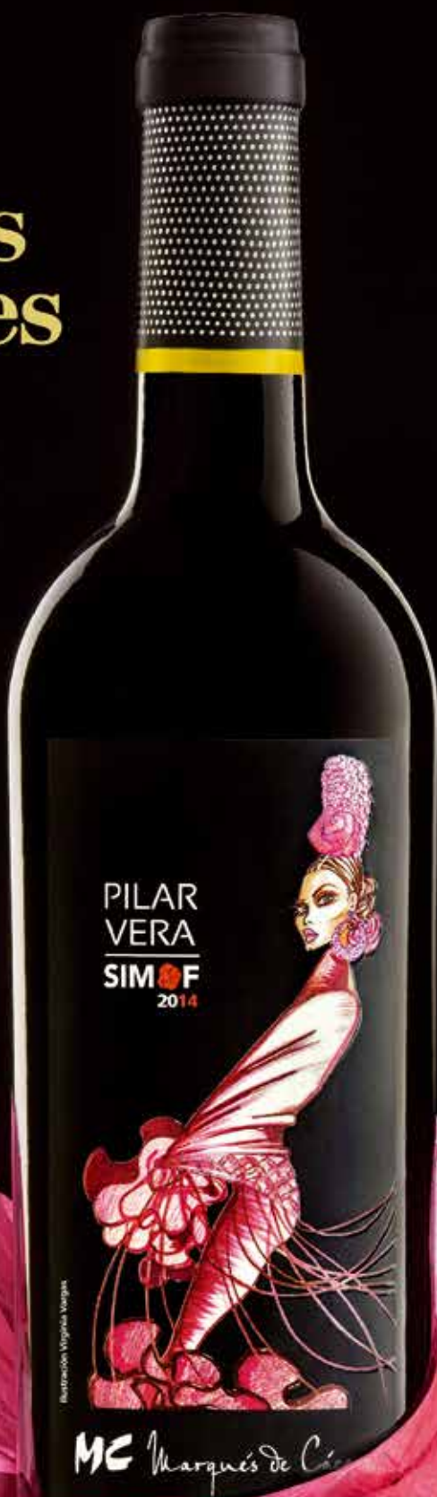
Ilustración Virginia Vargas